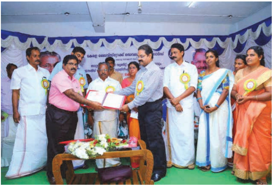
വെറ്ററിനറി സർവ്വകലാശാലയുമായി ചേർന്ന് കുളത്തുപ്പുഴയിൽ അഡ്വാൻസ്ഡ് ലൈവ്സ്റ്റോക്ക് ട്രെയിനിംഗ് സെന്റർ പ്രവർത്തനമാരംഭിച്ചു.