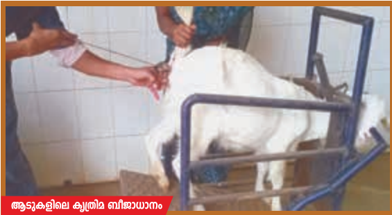
ആടുകളിലെ കൃത്രിമ ബീജായാനം

സംസ്ഥാനത്ത് കന്നുകാലികൾക്ക് നിലവിൽ 2939 കൃത്രിമ ബീജായാനകേന്ദ്രങ്ങളാണുള്ളത്. എന്നാൽ ഇവയിൽ ആടുകൾക്ക് കൃത്രിമബീജായാനത്തിനുള്ള സൗകര്യങ്ങൾ ഒരുക്കിയിട്ടുള്ളത് 689 കേന്ദ്രങ്ങളിൽ മാത്രമാണ്. ഈ സൗകര്യങ്ങൾ 500 കേന്ദ്രങ്ങളിൽകൂടി ഏർപ്പെടുത്തുന്നതിനും, ബന്ധപ്പെട്ട കേന്ദ്രങ്ങളിലെ ഡോക്ടർമാർക്കും ലൈവ്സ്റ്റോക്ക് ഇൻസ്പെക്ടർമാർക്കും ഇതിൽ വിദഗ്ദ്ധ പരിശീലനവും നൽകുന്നതിനും വിപുലമായ പദ്ധതി കെ.എൽ.ഡി.ബോർഡ് നടപ്പിലാക്കുന്നു. "ദേശീയ ലൈവ്സ്റ്റോക്ക് മിഷന്റെ" ഭാഗമായി ഈ പദ്ധതിയ്ക്ക് സർക്കാർ അംഗീകാരവും ലഭിച്ചുകഴിഞ്ഞു. 2020 ഏപ്രിൽ മുതൽ പദ്ധതി നടപ്പിലാക്കുന്നതാണ്.