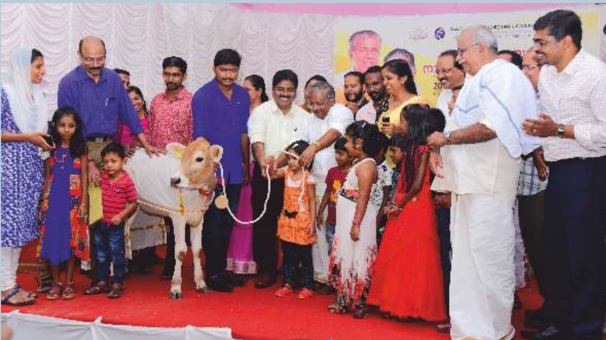
ആയുർ എൽ.പി.സ്കൂൾ വിദ്യാർത്ഥികൾക്ക് നാടൻ പശുക്കുട്ടി വിതരണം ബഹു.മന്ത്രി നിർവ്വഹിക്കുന്നു.