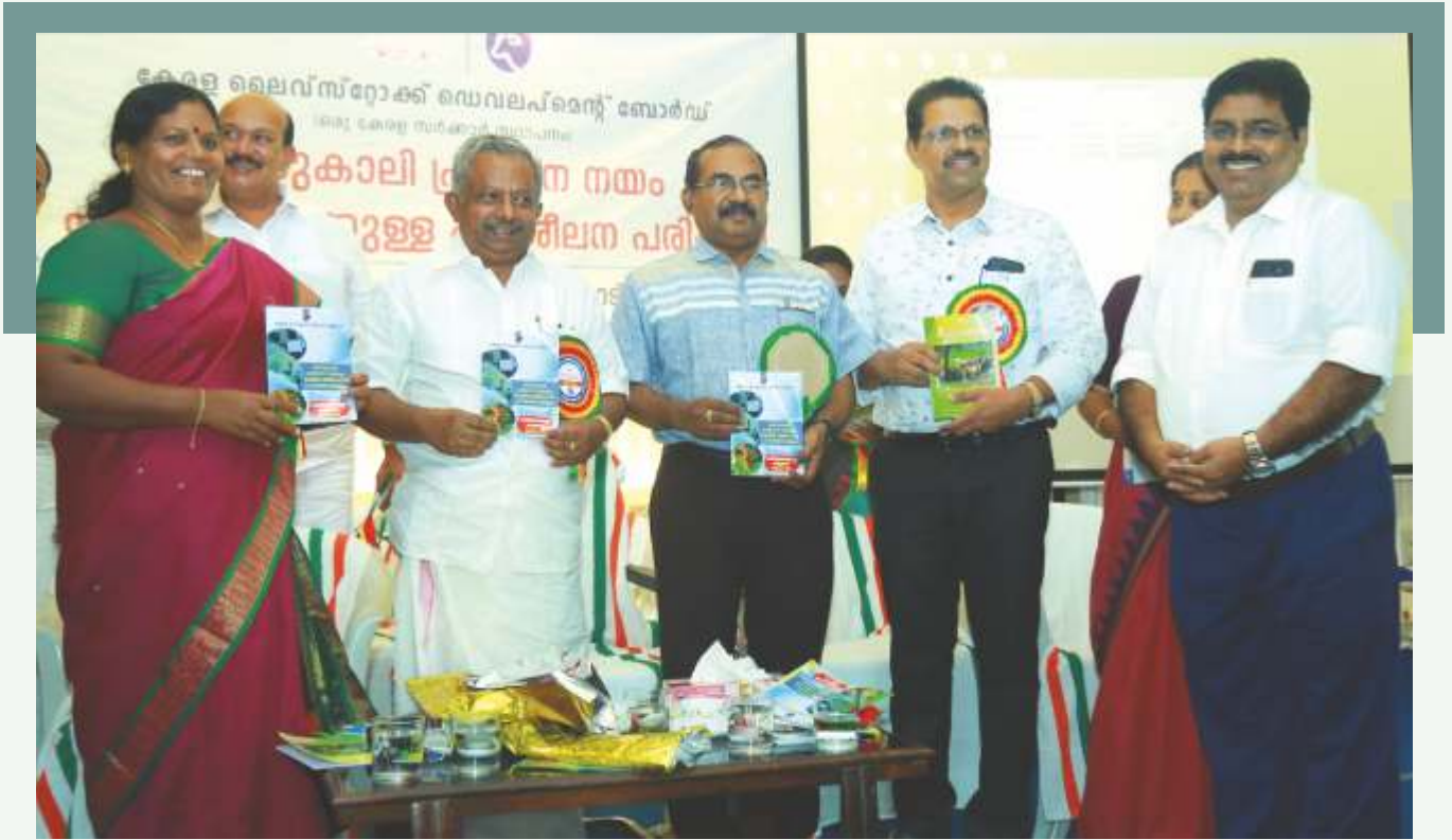
പ്രജനന നയത്തെക്കുറിച്ചും കൃത്രിമ ബീജാധാനത്തെക്കുറിച്ചും പരിശീലകർക്കുള്ള മാർഗ്ഗരേഖയുടെ പ്രകാശനം ബഹു. മന്ത്രി നിർവ്വഹിച്ചപ്പോൾ

വിൽ സംസ്ഥാനത്തുണ്ടായ സാമൂഹ്യ-സാംസ്കാരിക - സാമ്പത്തിക മാറ്റങ്ങൾ, വിഭവ ലഭ്യതയിലുള്ള വ്യതിയാനങ്ങൾ, കാലാവസ്ഥാ വ്യതിയാനം പോലുള്ള പ്രതിഭാസങ്ങൾ എന്നിവയൊക്കെ ഉൾക്കൊണ്ടുകൊണ്ട് മുമ്പോട്ടുള്ള പ്രയാണം ഏത് രീതിയിലായിരിക്കണം എന്നതിനെക്കുറിച്ച് ഒരു പ്രായോഗിക തീരുമാനത്തിലെത്തുവാൻ വേണ്ടിയാണ് ഈ ശില്പശാല നടത്തിയത്.