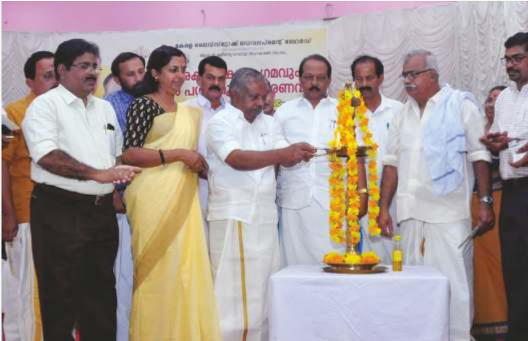
2019 ഡിസംബർ 8-ാം തീയതി ആയുരിൽ സംഘടിപ്പിച്ച ക്ഷീര കർഷക സംഗമം ബഹു. വനം - മൃഗസംരക്ഷണം-ക്ഷീര വികസനം- മൃഗശാല വകുപ്പ് മന്ത്രി. അഡ്വ. കെ. രാജു ഉദ്ഘാടനം ചെയ്യുന്നു.

ആയുർ ക്ഷീരവ്യവസായ സഹകരണ സംഘത്തിന്റേയും കേരള ലൈവ്സ്റ്റോക്ക് ഡെവലപ്മെന്റ് ബോർഡിന്റേയും സംയുക്താഭിമുഖ്യത്തിൽ 2019 ഡിസംബർ 8-ാം തീയതി സംഘടിപ്പിച്ച ക്ഷീരകർഷക സംഗമവും നാടൻ പശുക്കുട്ടി വിതരണവും വനം - വന്യജീവി മൃഗസംരക്ഷണ വകുപ്പ് മന്ത്രി അഡ്വ. കെ. രാജു ഉദ്ഘാടനം ചെയ്തു.