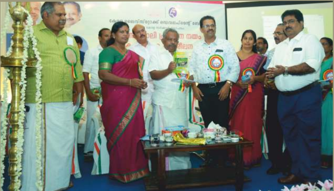
സംസ്ഥാന സർക്കാരിന്റെ കന്നുകാലി പ്രജനന നയരേഖ ബഹു. മന്ത്രി മൃഗസംരക്ഷണ വകുപ്പ് ഡയറക്ടർക്ക് നൽകി പ്രകാശനം ചെയ്തു.

സംസ്ഥാനത്തിന്റെ കന്നുകാലി പ്രജനന നയരേഖയും, പ്രജനന നയത്തെക്കുറിച്ചും കൃത്രിമ ബീജാധാനത്തെക്കുറിച്ചും പരിശീലകർക്കുള്ള മാർഗ്ഗരേഖയും പ്രസ്തുത പരിപാടിയിൽ പ്രകാശനം ചെയ്തു. കോഴിക്കോട്, വയനാട് ജില്ലകളിലേയ്ക്കുള്ള പരിശീലന പരിപാടി 2020 ഫെബ്രുവരി മാസത്തിൽ നടക്കുന്നതാണ്.