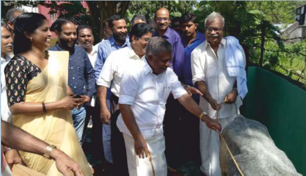
ആയുർ കളക്ടീവ് ഡയറി ഫാമിനുള്ള ആദ്യഘട്ട കിടാരി വിതരണം ബഹു.മന്ത്രി നിർവ്വഹിക്കുന്നു.